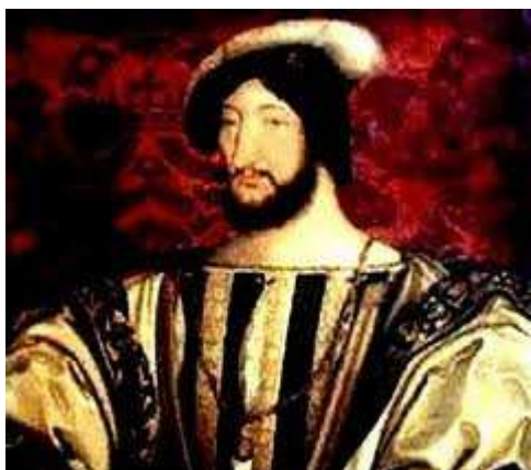
Francesco I re di Francia

Il giorno della visita sarà attivo il cellulare 338 4445930