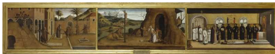
San Girolamo, Lazzaro Bastiani