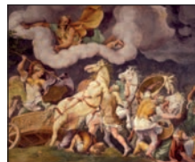
Pal. Ducale, Sala di Troia (Mn)