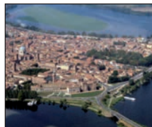
Lago di Mantova (Mn)