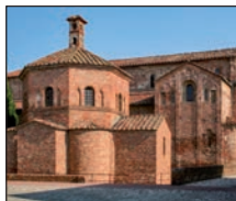
Lomello, S. Maria Maggiore