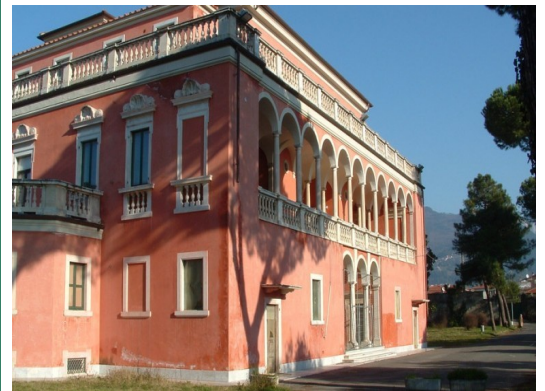
Villa La Rinchiostra