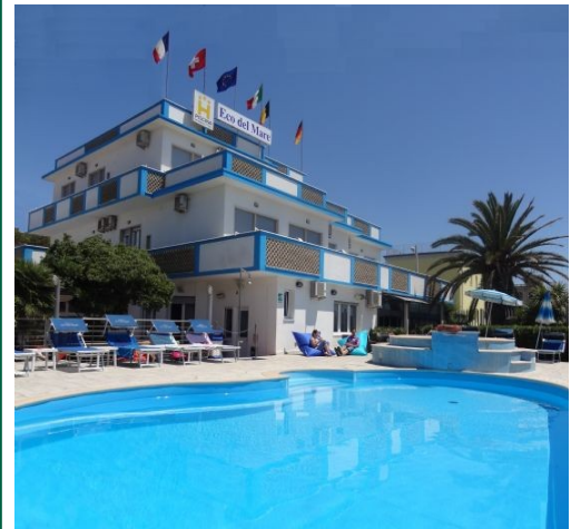
Hotel Eco del Mare

Indicante le generalità del versante. In caso di disdetta la quota potrà essere restituita, al netto delle penali, solo se comunicata entro il 20 agosto 2019. Dopo tale data non verrà restituita, salvo stipula dell'assicurazione contro annullamento.